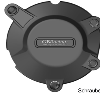
Schraube 3 M6 x 45