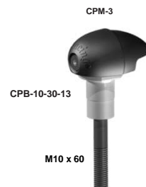
M10 x 60