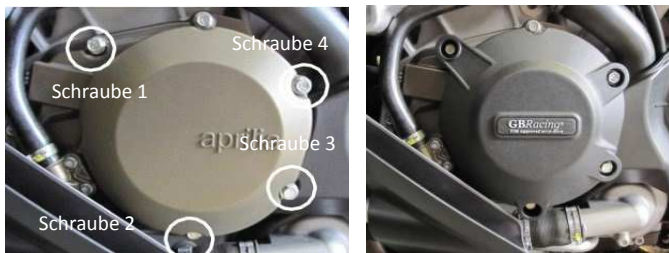
Schraube 1 M6 x 30

ACHTUNG: Bitte Schrauben nicht zu fest anziehen